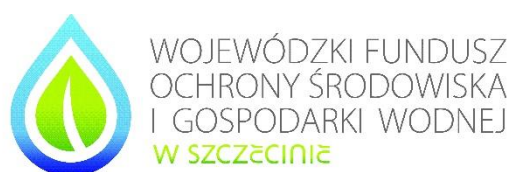
Tablica 2 – wymiar 840 x 597 mm

Zadanie pn. „Nazwa projektu” dofinansowane przez Wojewódzki Fundusz Ochrony Środowiska i Gospodarki Wodnej w Szczecinie