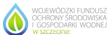
Tablica 3 – wymiar 148 x 105 mm

Zakup dofinansowany przez Wojewódzki Fundusz Ochrony Środowiska i Gospodarki Wodnej w Szczecinie